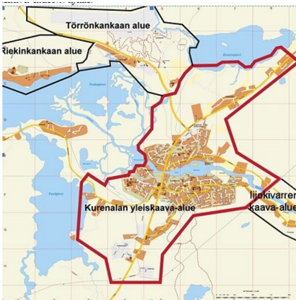
Kurenalan yleiskaava-alue rajatta kartalle paksummalla punaisella viivalla.

Tämä osallistumis- ja arviointisuunnitelma koskee Pudasjärven kaupungin Kurenalan keskustan ja sen lähiympäristön yleiskaavan alueelle laadittavaa osayleiskaavaa.