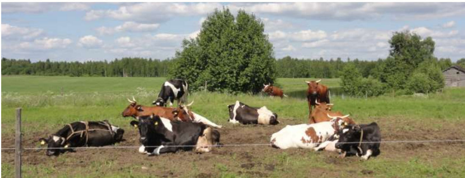
Kuva 10. Maatalous pitää yllä Livojoen ranta-alueiden kulttuurivaikutteista ympäristöä.