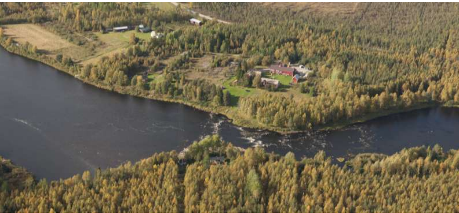
Kuva 11. Kynkään kylän asutusta ja Kynkään koski. Joen ylle sijoittuva voimajohto aiheuttaa koskimaisemaan maisemahäiriön.