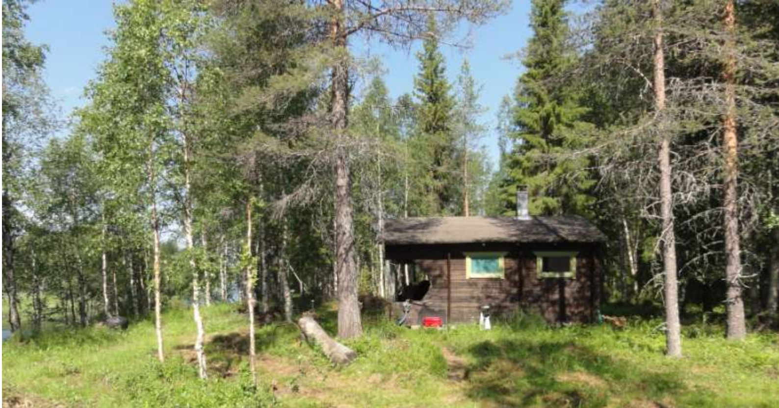
Kuva 12. Livojoen varralle oleva lomarakentaminen on sijoitettu pääosin luonnon helmaan ja puuston suojaan.