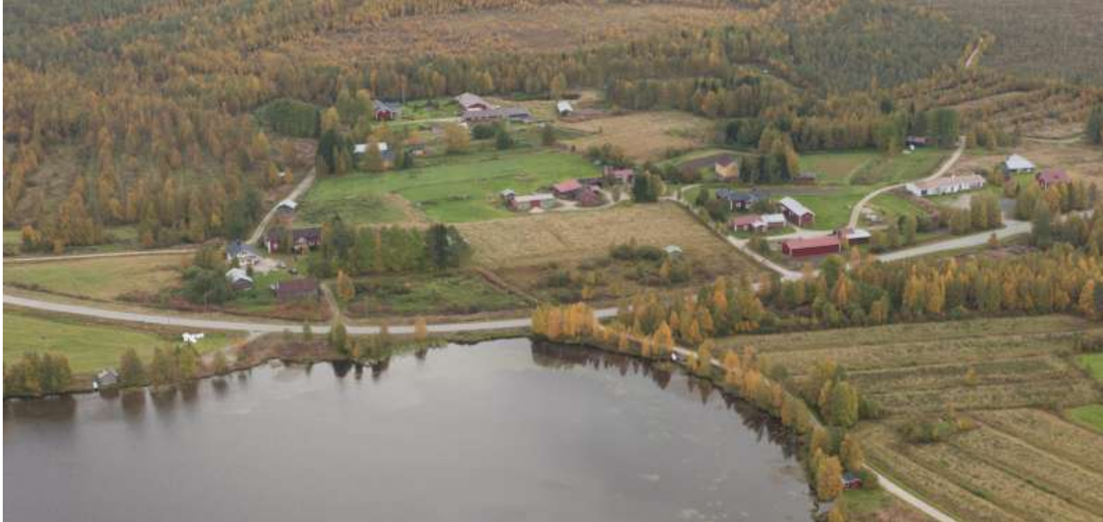
Kuva 5. Sarajärven ranta-alueet ovat maakunnallisesti merkittävää kulttuurihistoriallista aluetta.