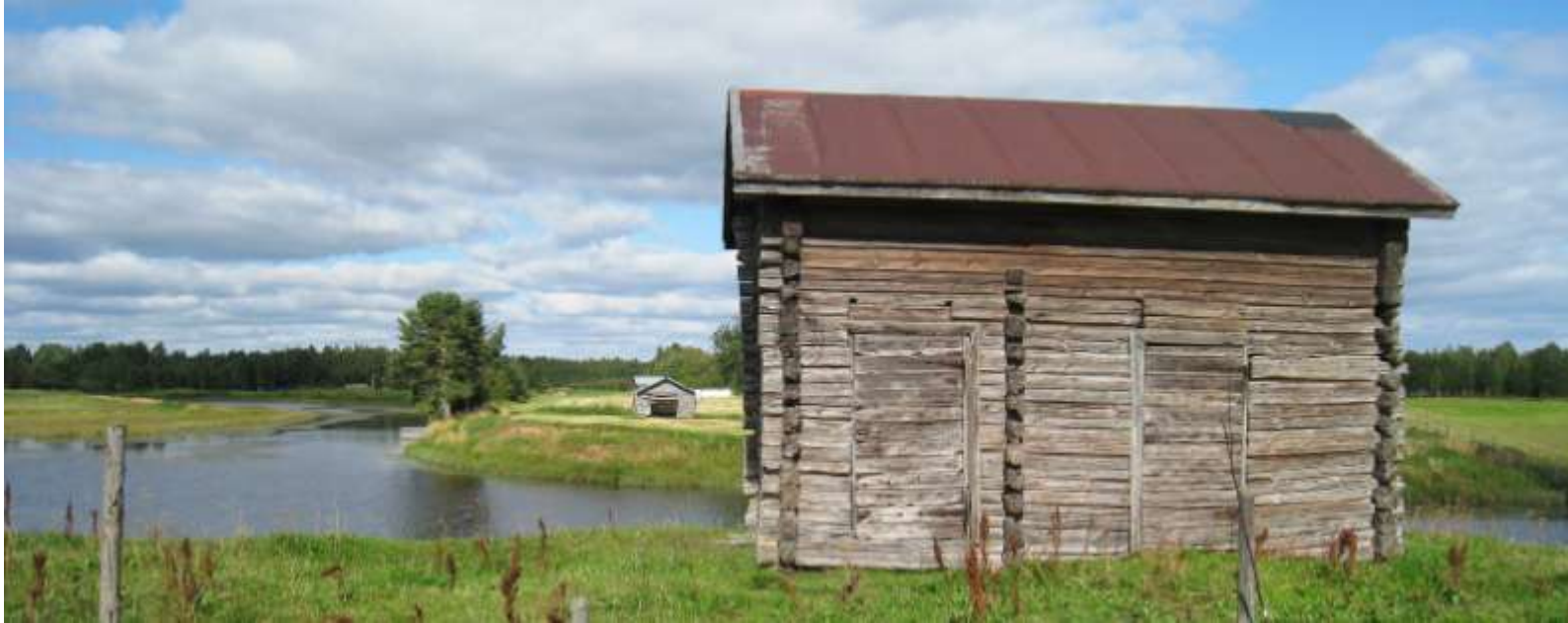
Kuva 9. Maaseutumaisemaa Livon kylän pelloilla.