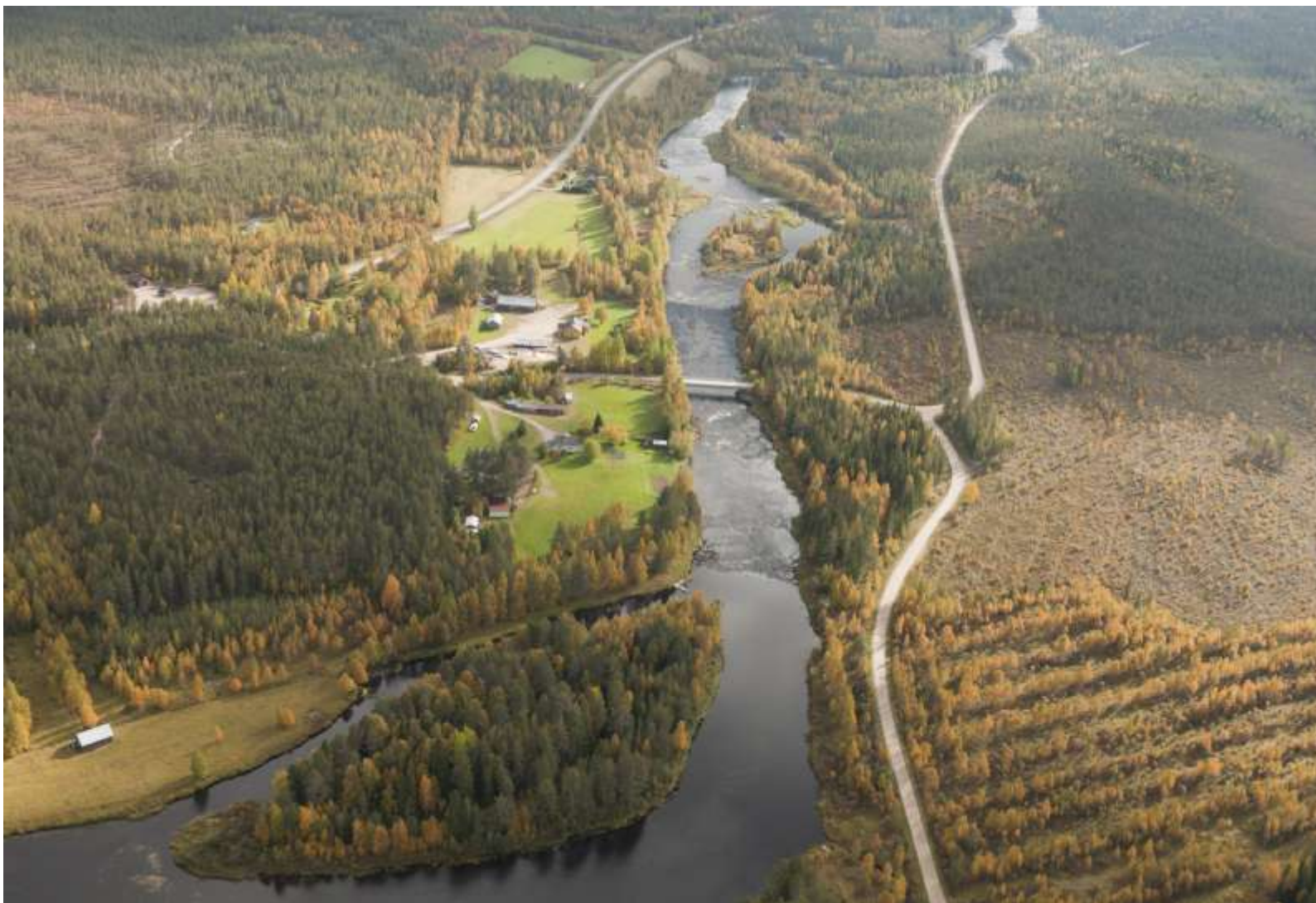
Kuva 7. Suvannonkylän kohdalle sijoittuu pitkä koskijakso.