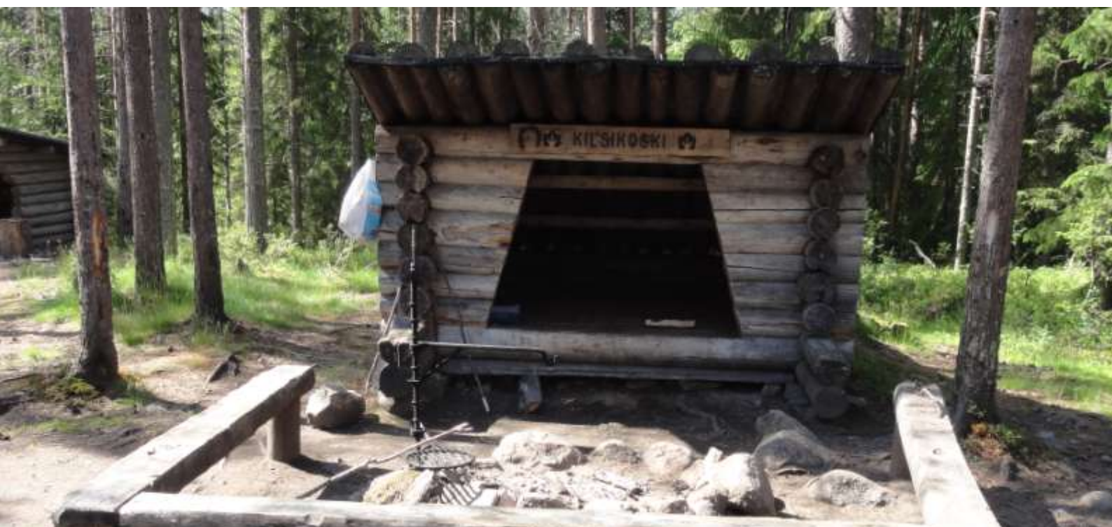
Kuva 13. Livojoki on huomattava virkistyskohde. Ranta-alueilla on huollettuja virkistyskäyttörakenteita.

Erityisesti loma-asuminen erottuu maisemasta suunnittelualueen koillisosissa, jossa ei ole muutoin kulttuurivaikutteista ympäristöä sekä Rytinkijärven ranta-alueilla.