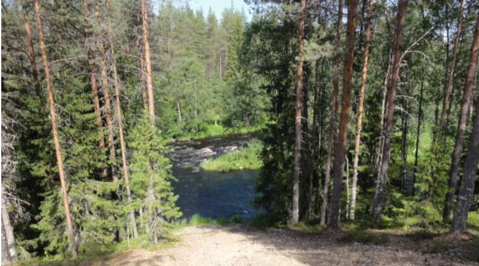
Kuva 6. Kilsikosken ympäristössä jokitörmät ovat jyrkät.