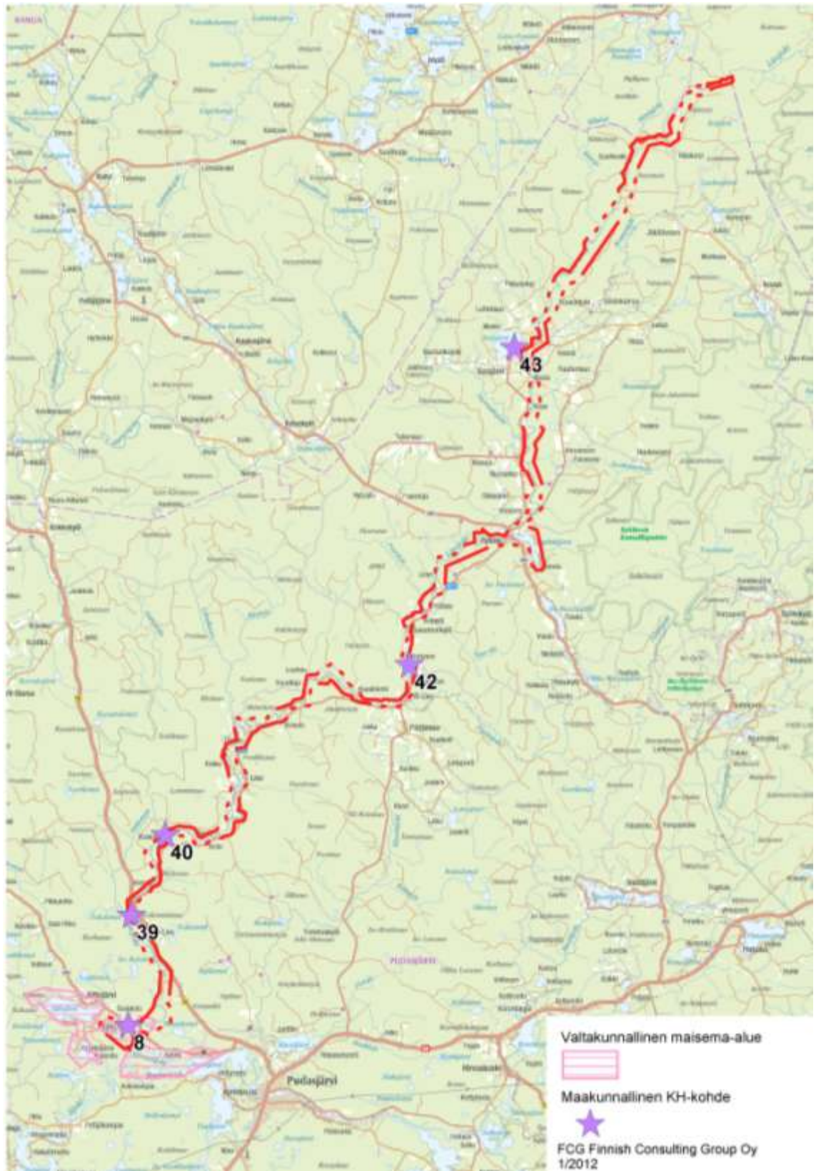
Kuva 4 Livojoen varteen suunnittelualueelle sijoittuvat maakunnallisesti merkittävät kulttuurihistorialliset kohteet ja Aittojärvi-Kyngäs valtakunnallinen maisema-alue. Kohteen 8 alueelle sijoittuu RKY 2009 kohde "Pudasjärven pyramidikattoiset kesänavetat".