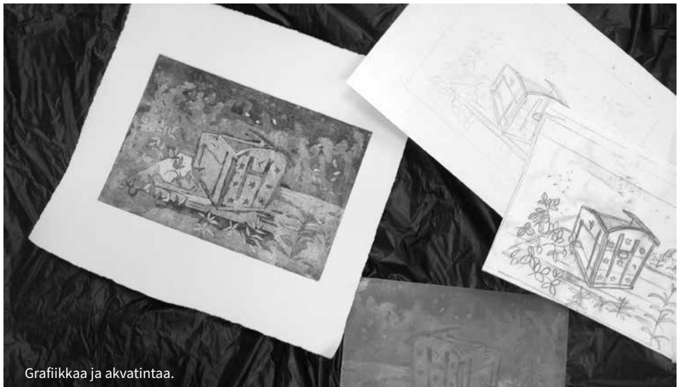
Grafiikkaa ja akvatintaa.

ke 17.30-18.15, Kansalaisopisto MUSIIKINTEORIALUOKKA R2 6.9.-13.12.2017 ja 11.1.-25.4.2018 Marjut Kossi-Saarela Oppitunteja 14 sl / 16 kl. Kurssimaksu 28,00 € Infotilaisuus Lakarin koululla 4.9. klo 18.00.