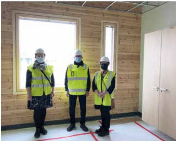
Kansalaisopiston toimisto muuttaa syksyllä hyvän olon keskus Pirttiin. Henkilöstö tutustumassa uuteen toimistotilaan.